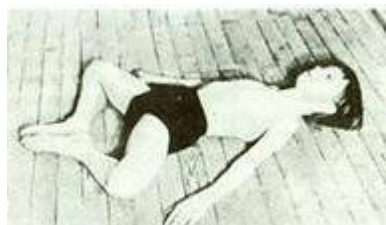
Рисунок 2 Поза "Бабочка"