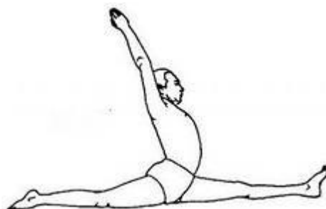
Рисунок 4 Шпагат на портере