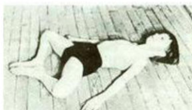
Рисунок 2 Поза "Бабочка"