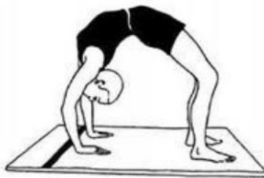
Рисунок 5 Перегиб корпуса у станка Рисунок 6 "Мост"

6. Проверка «прыгучести» (выполнить «трамплинный прыжок»).