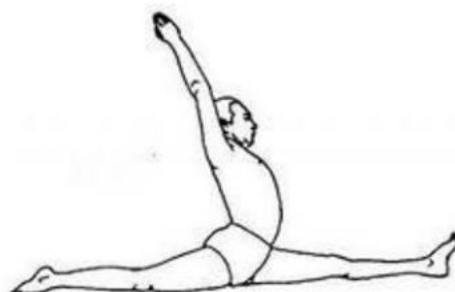
Рисунок 4 Шпагат на портере